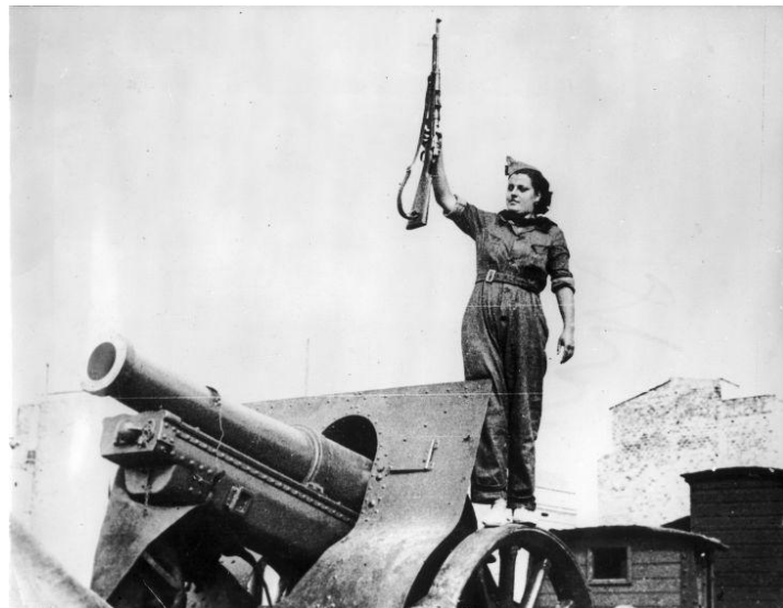
Mujer dispuesta a luchar.

Republicana), con el Partido Socialista Obrero Español (PSOE), con el Partido Comunista de España (PCE), con el Partido Obrero de Unificación Marxista (OUM), con el Partido Sindicalista de origen anarquista y con Esquerra Republicana de Catalunya. Se trataba de un movimiento obrero apoyado por los sindicatos de UGT y CNT. El segundo se organizó en torno a parte del alto mando militar conocido al principio como Junta de Defensa Nacional. Posteriormente, se sustituyó por el nombramiento de Francisco Franco como Generalísimo y Jefe de Gobierno. Estaba compuesto por la Falange Española, los carlistas, los monárquicos alfonsinos de Renovación Española y grupos conservadores como la CEDA, la Liga Regionalista y otros. Además, estaba apoyado por la Iglesia Católica.