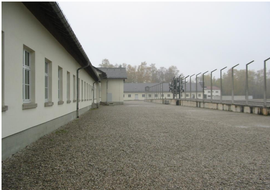
Campo de Dachau.

El primero se construye en Dachau con las estructuras administrativas, técnicas de dominio y sistemas de tortura y alineación. Posteriormente se copia a otros campos.