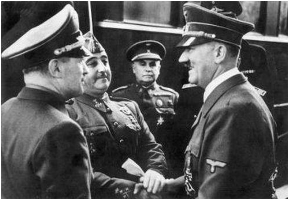
Hitler y Franco en Hendaya.

El gobierno español fascista fue el único que permitió que fuera un Estado diferente el que se encargase de la represión de sus compatriotas.