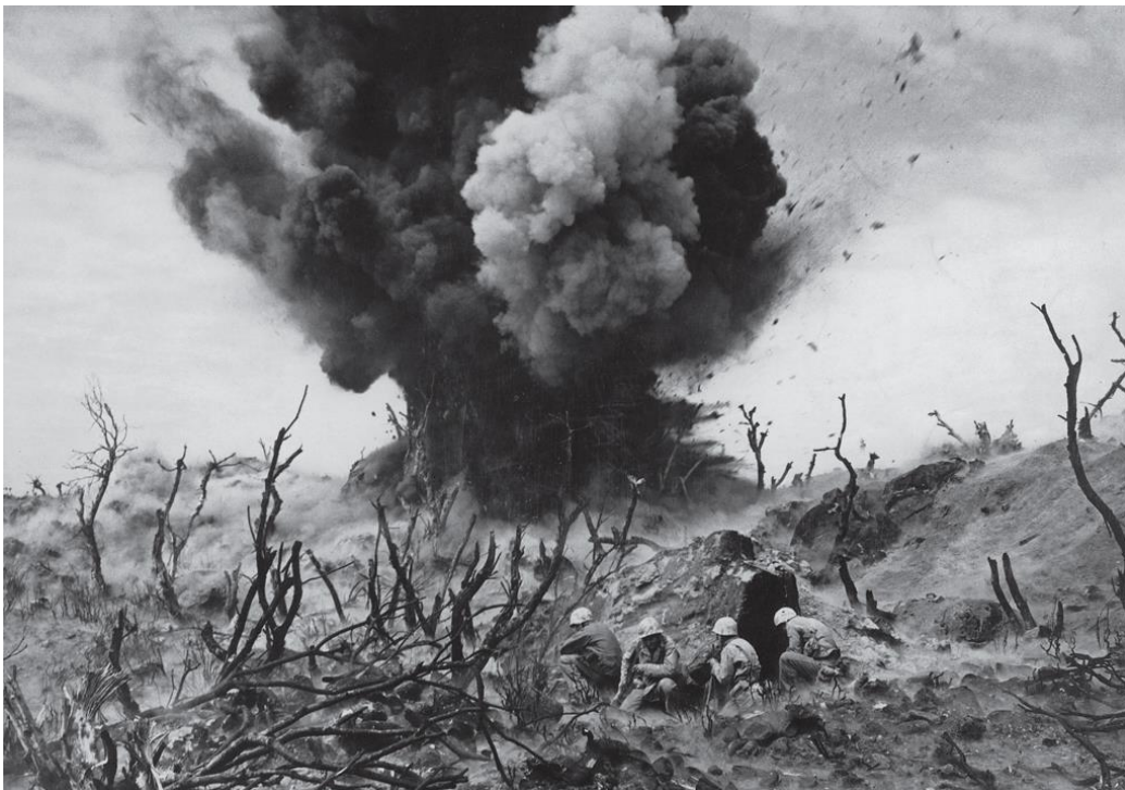
A la sombra de una explosión (Iwo Jima, 1945).

Como podemos comprobar, hay un colectivo que se ha estado olvidando: los españoles. Este olvido fue fomentado durante la transición española a través de un pacto de silencio, por lo que los supervivientes no han obtenido el reconocimiento que se merecen y no se recuerda a las víctimas de aquél infierno. Se estima que su presencia alcanza aproximadamente entre 10.000 y 15.000 personas.