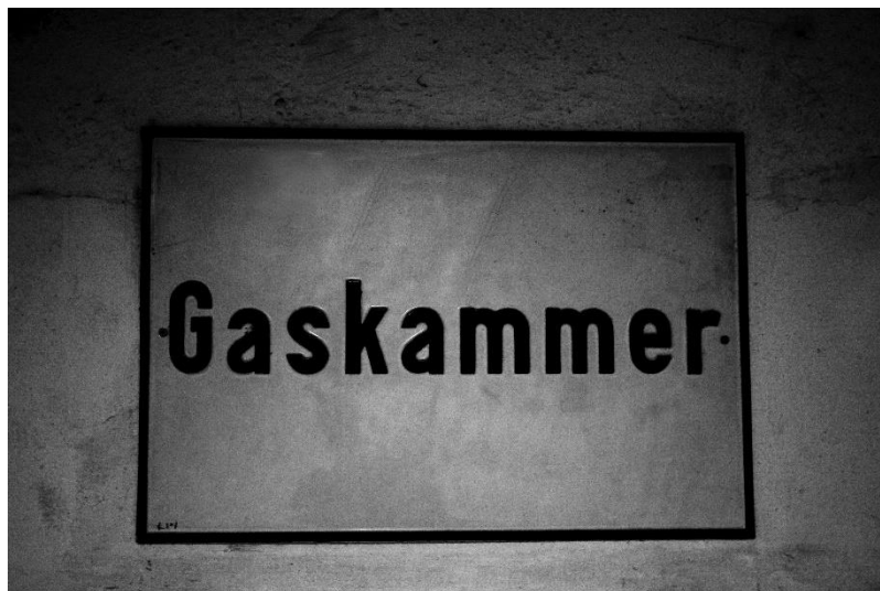
Cámara de gas.

Posteriormente, el proceso de destrucción de los cadáveres se centraba en la cremación, convirtiendo a las personas en cenizas, y en última instancia, en humo. Las chimeneas funcionaban todos los días del año, las 24 horas del día, y dependiendo de la dirección del aire les llegaba más o menos el olor a los que seguían vivos. En las fechas festivas funcionaban más debido a las borracheras de los SS, que mataban más.