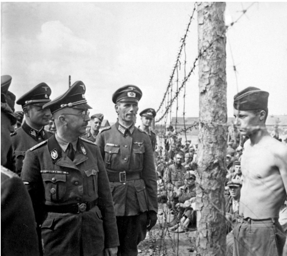
Heinrich Himmler inspeccionando un campo de concentración.

Utilizaron distintos métodos para el exterminio de los diferentes colectivos: asfixia por cámaras de gas, disparos, ahorcamiento, trabajos forzados, hambre, experimentos pseudocientíficos, tortura médica, palizas, etc.