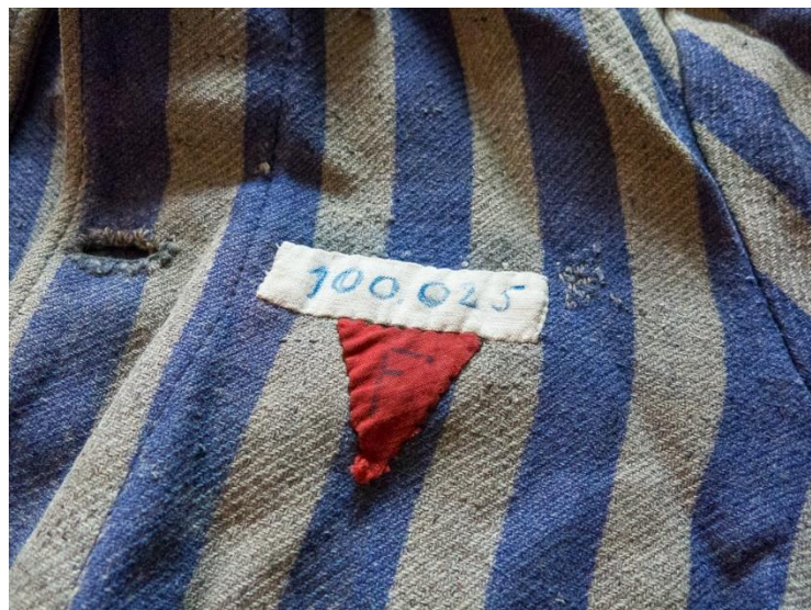
Uniforme de preso en el campo de concentración.

Después, unos médicos de las SS hacían una especie de revisión médica, en la que otra persona, normalmente otro preso, apuntaba en cartulinas los números de matrículas dependiendo de si tenían sarna, tuberculosis, otras enfermedades o eran considerados como inválidos. Una vez pasado el control, si eran calificados aptos para el trabajo se iniciaba un periodo de cuarentena en el que esperaban la adjudicación a algún grupo de trabajo.